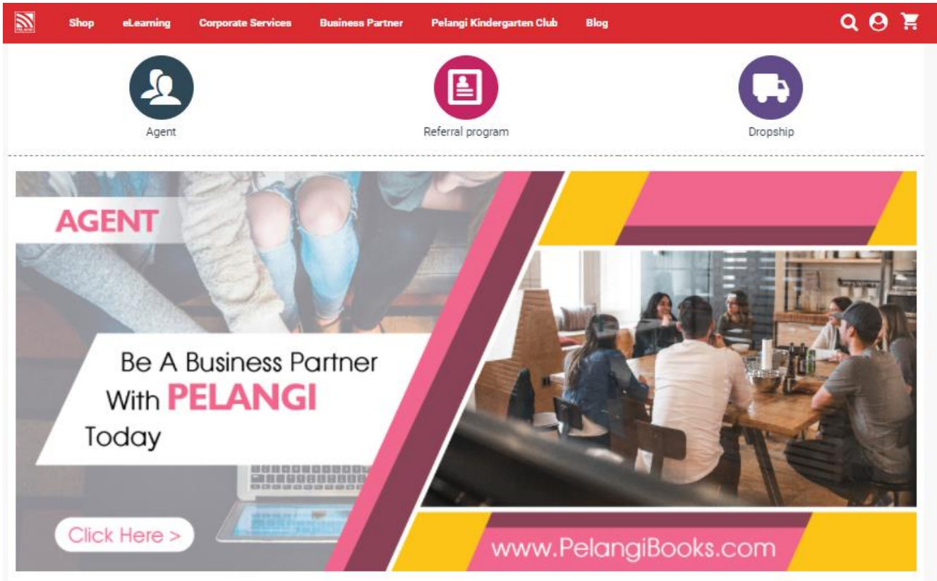
Gambar 3: Pautan rakan kongsi perniagaan