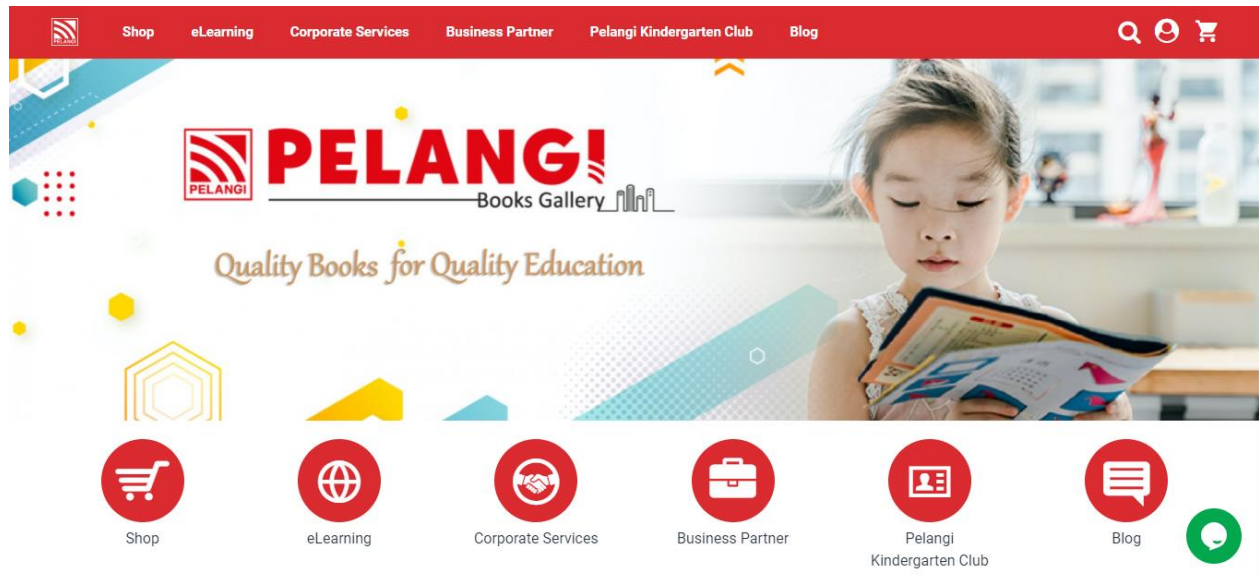
Gambar 1: Portal Pelangibooks.com berwajah baharu